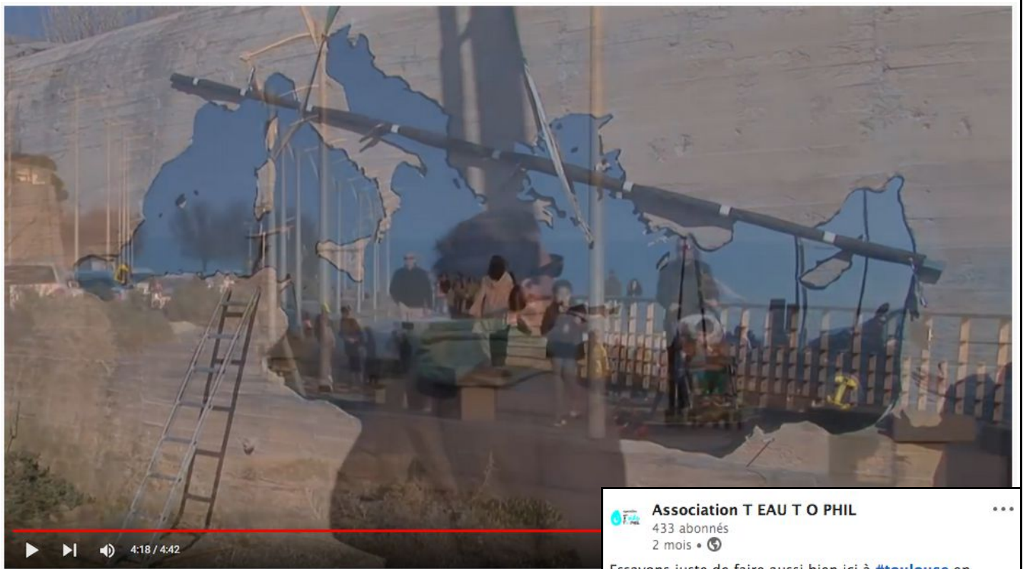
La Traversée - Jean Denant - Ville de Sète

https://www.youtube.com/watch?v=azwXxVD0cQs (avec extrait ci-dessus de la vidéo) https://www.linkedin.com/feed/update/urn:li:activity:6919891367649280000 (avec copie ci-contre de la publication originale et de son partage avec ci-dessous un commentaire. Avril 2022 avec capture d'écran en Juin 2022).